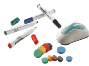
Zubehör für Whiteboards