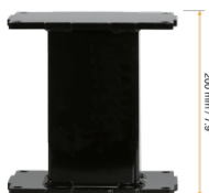
Extender für Aluminiumhubsäulen