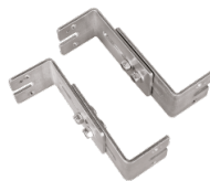
Montagesatz aus verstellbaren Wandhalterungen