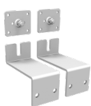
2 verzinkte Wandhalterungen