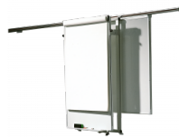
Ablageleiste 55 cm breit