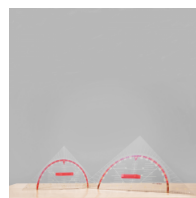
Geodreieck, Geometrie-Dreieck der Serie Profi Linie