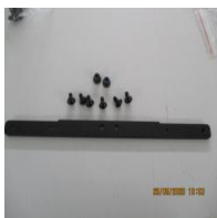
Ersatzteilset für vordere Ablage von SCENHVCB