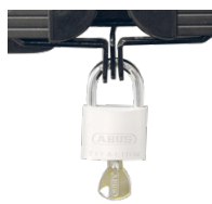
Halterungen und Flügelschloss