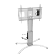
Universalhalterung für PCs