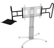
Zwei große, stabile Griffe inklusive Laptop-Ablage