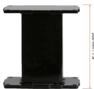
Extender für Aluminiumhubsäulen