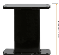
Extender für Aluminiumhubsäulen