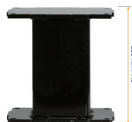
Extender für Aluminiumhubsäulen