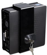
Abschließbare Mini-PC Halterung