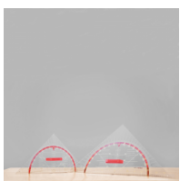
Geodreieck, Geometrie-Dreieck der Serie Profi Linie