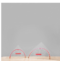
Geodreieck, Geometrie-Dreieck der Serie Profi Linie